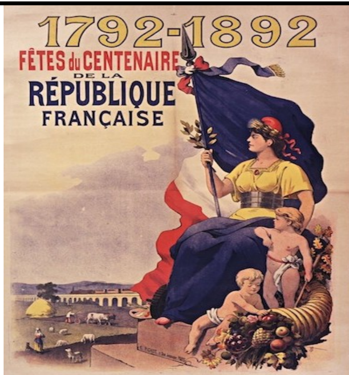
Affiche de 1892, éditée sous la IIIe République