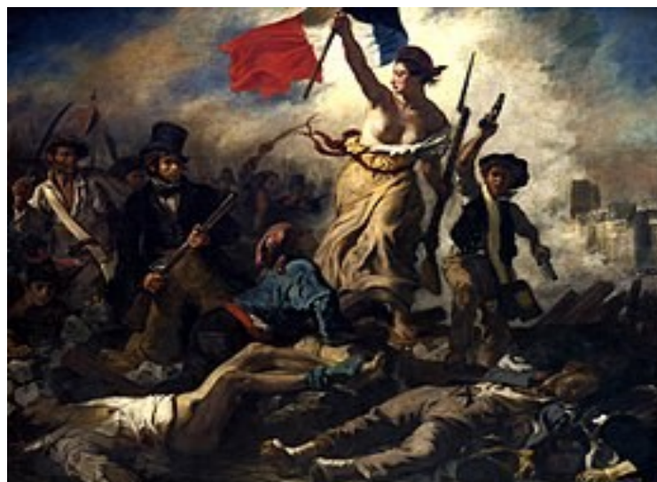
La Liberté guidant le peuple,