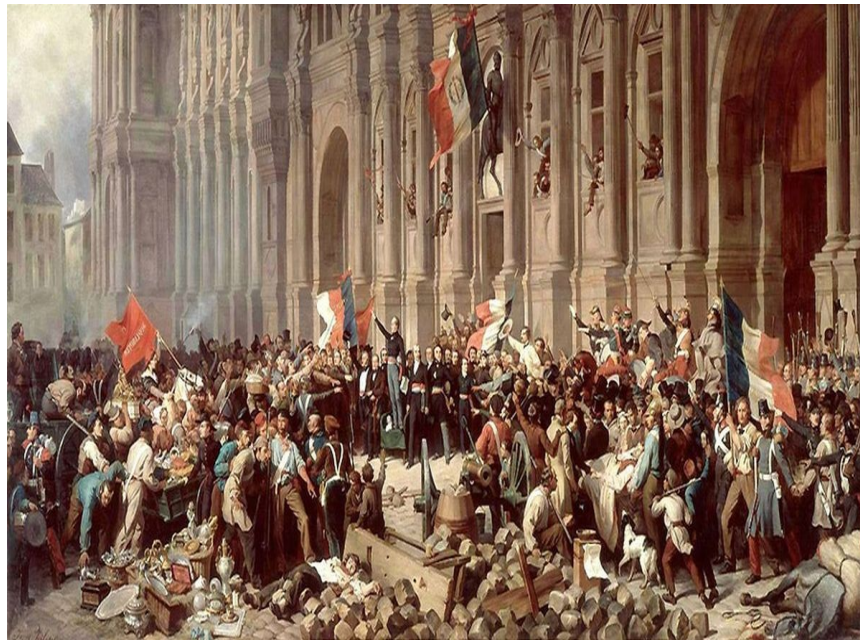
Peinture de Félix Philippoteaux Lamartine devant l'hotel de ville de Paris avant la proclamation de la IIe République