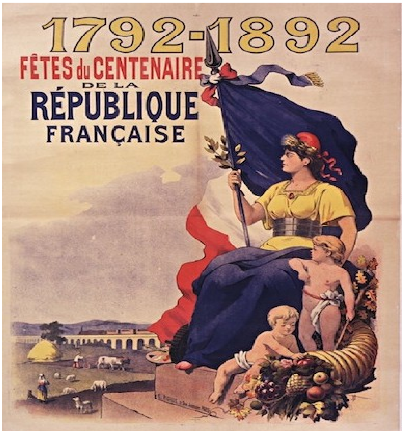
Affiche de 1892